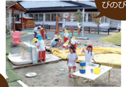
遊具や砂場のある園庭でのびのび遊ぼう