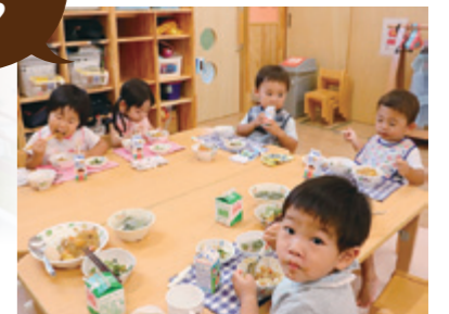
園内で手作りされる栄養満点の給食♡