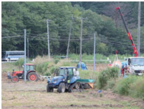
混合剤の施肥とゼオライトの散布を行った後に、耕地の碎土と耕うん・整地を行います

農地の地力回復工事が二枚橋須萱、白石行政区で始まりました。溶リン(10aあたり100kg)・ケイ酸カリウム(10aあたり80kg)の混合剤を施肥し、粉碎加工したゼオライト(10aあたり1t)を散布。その後、耕うんして整地を行います。工事は順次拡大し、次年度以降も継続します。