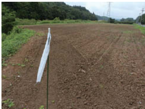
地力回復工事を終えたほ場には、1か月程度の期間、白い旗を立てて表示をしています