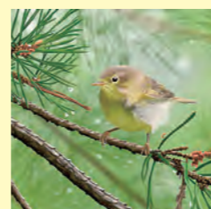
村の鳥・うぐいす (昭和51年制定)