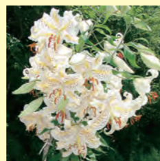
村の花・山百合 (昭和51年制定)