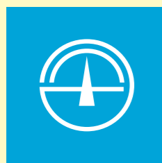
飯舘村の村章 (昭和41年制定)