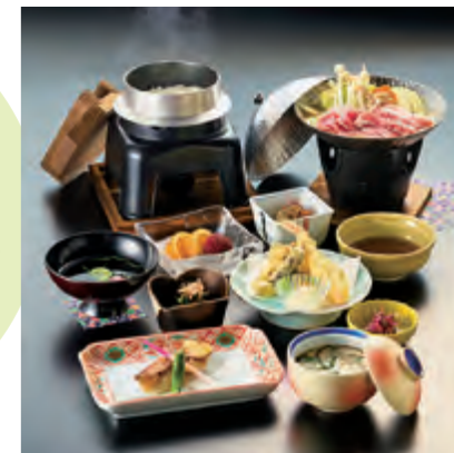
食事付き宿泊特別プラン 夕食の一例

食事と入浴がセットになった日帰り昼食休憩プランの他、慶事や法要のプランもあります。オプションの特別料理も充実し、予算に応じた相談にも対応。