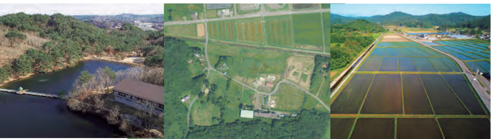
村民の森あいの沢を再整備します。

この重点事項と基本施策(P12参照)は、令和8年度から10年間の7次総計画期間中、一貫して取り組む方針です。また、各分野に70周年記念事業をそれぞれ計上しています。