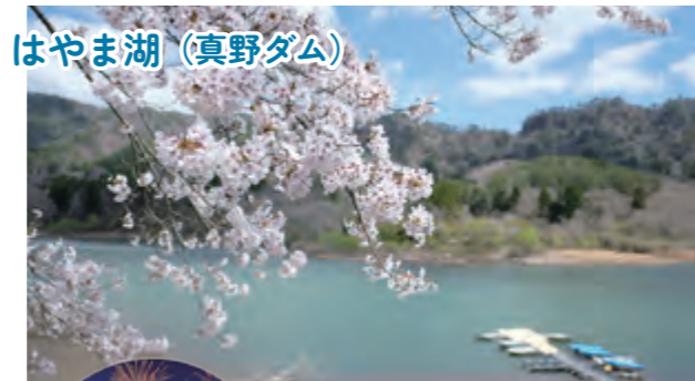
はやま湖 (真野ダム)