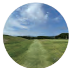
いいたてパーク ゴルフ場

いいたてスポーツ公園、いいたてパークゴルフ場、飯館村地域防災センター、いいたて移住サポートセンター他、公共施設の情報は、本紙P20をご覧ください。