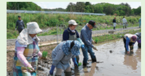
5月23日、長泥地区で行われた2つの田植えに、住民の皆さんが駆け付けました。表紙は、今年から村が試験栽培を行う第四工区の水田です。住民の皆さんが一部で手植えを行い、「久しぶりだがうまいもんだな」「やっぱり気持ちがいいねえ」と笑顔を交わしていました。詳しくはP4からの特集をご覧ください。

村はイベントや取り組みを取材し広報紙やホームページに掲載しています。写真掲載に不都合がある方は、お手数ですが、村づくり推進課企画定住係 ☎0244-42-1613 までお知らせください。