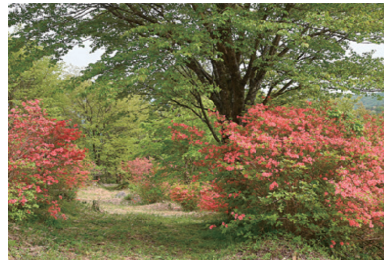
美しい新緑の中に、人の背丈以上に大きく育ったヤマツツジが点在。群生を縫うように整備された遊歩道を散策することができます。