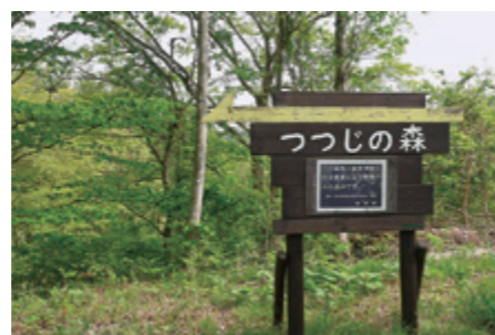
つつじの森入口の看板。看板の横と、さらに細い舗装道路を進んだ電波塔付近に駐車場があります。左の写真は遊歩道を整備した際に撮影したものです。遊歩道にウッドチップを敷き詰めています。