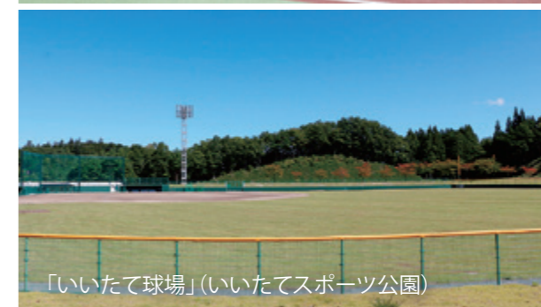
「いいたて球場」(いいたてスポーツ公園)