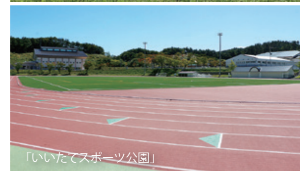
「いいたてスポーツ公園」