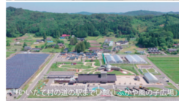
「いいたて村の道の駅までい館」「ふかや風の子広場」