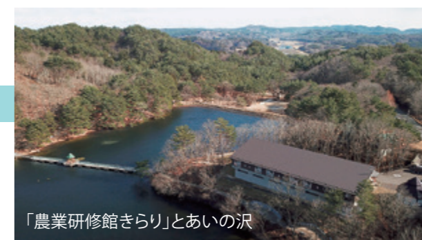
「農業研修館きらり」とあいの沢