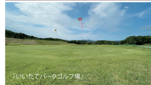
「いいたてパークゴルフ場」