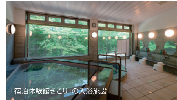
「宿泊体験館きこり」の入浴施設