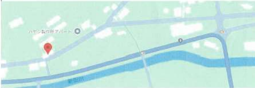
(11)配置図・間取り図