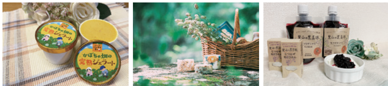
村産の返礼品は現在19品。感謝と共に飯館村の魅力を伝えています。※写真は一部のイメージです。

村は、返礼品への出品を募集しています。出品を希望される事業者の方は村づくり推進課企画定住係 ☎0244-42-1622までお問い合わせください。出品については、総務省が定めた条件に適合しているかの確認、インターネット取り引きの手続き等に2か月程度かかります。