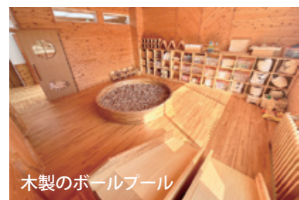
木製のボールプール

全村避難中に福島市で開設した、村の子育て支援センター「すくすく」で使われていたものです。