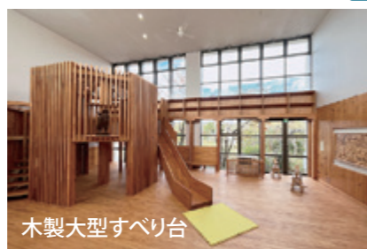
木製大型すべり台

全村避難中に福島市で開設した、村の子育て支援センター「すくすく」で使われていたものです。