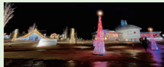
「ふかや風の子広場」にイルミネーションが灯りました。点灯式が行われた11月25日は、本格的な冬の到来を思わせる厳しい寒さになりましたが、たくさんのご家族が会場を訪れ、7回目となる光のイベントの開幕を楽しみました。イルミネーションは1月14日までの期間、午後4時から9時まで点灯されません。P4の関連記事もご覧ください。

村はイベントや取り組みを取材し広報紙やホームページに掲載しています。写真掲載に不都合がある方は、お手数ですが、村づくり推進課企画定住係 ☎0244-42-1613 までお知らせください。