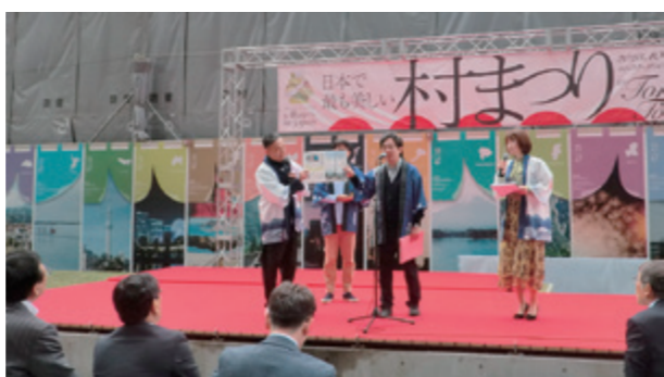
「日本で最も美しい村まつり2023 in TOKYO TORCH」。10月に東京都で開催され村も出展。物産などをPR。