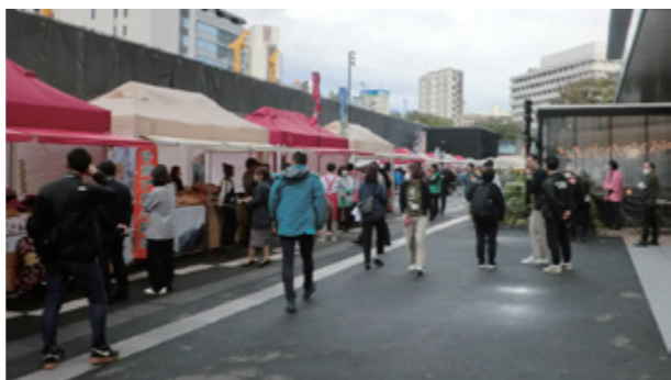
村まつりの一環で開催された「日本で最も美しい村マルシェ」。各町村の特産品や観光情報が並びました。

「日本で最も美しい村」連合は、「フランスの最も美しい村」運動を手本とし平成17年に任意団体として発足。翌18年に特定非営利活動法人(NPO法人)となりました。かけがえのない地域資源や美しい景観を有する町村が、誇りを持って地域づくりを行うことにより、農山漁村の文化や景観を保