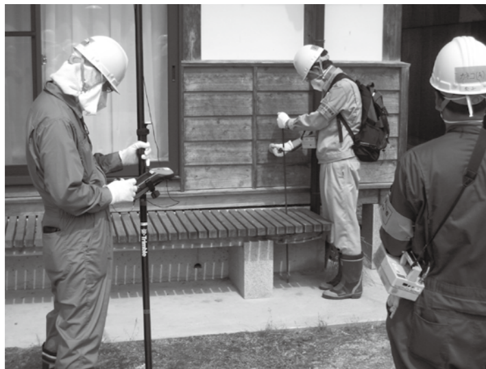
▲家屋・放射線モニタリング調査のようす（二枚橋）