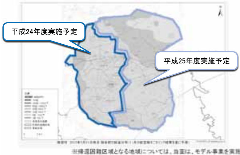
▲説明会提出資料

今回の住民説明会では、本格除染のスケジュールや、場所ごとの主な除染方法について説明がありました。 ここでは、本格除染の進め方や除染方法について、国の資料を基に紹介します。