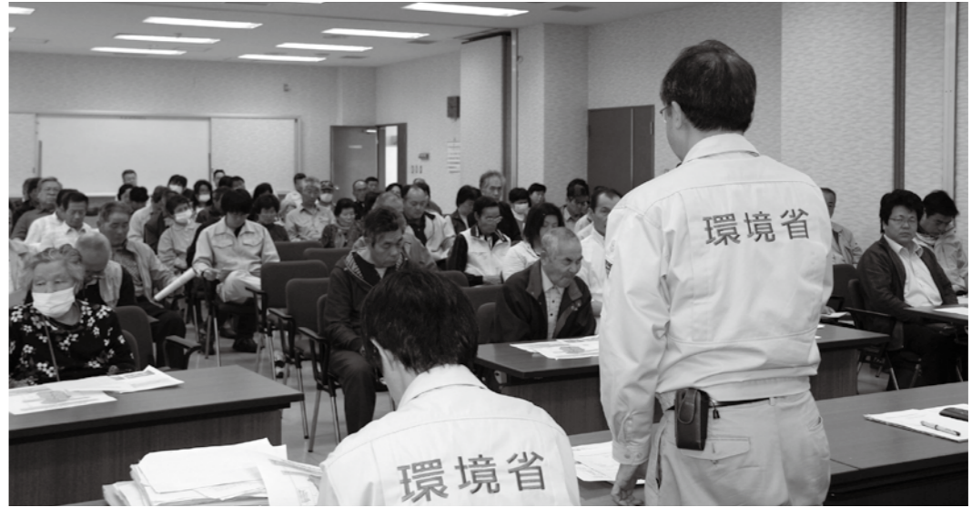
▲比曾行政区除染実施住民説明会のようす

東京電力(株)福島第一原子力発電所事故により、村内全域に大量に降り注いだ放射性物質の本格除染が始まります。 飯館村は、国の責任において除染が行われますが、まずは居住空間の除染が平成24年度・25年度の2年にわたって行われます。 今後、国による除染がどのように進んでいくのか、お知らせします。