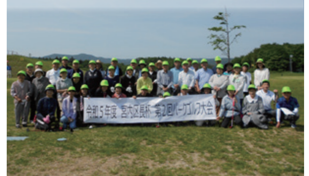
昨年10月に続く開催です。地元の仲間と和やかに。