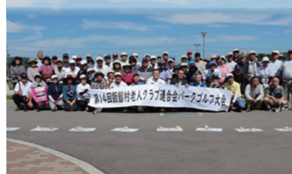
梅雨の晴れ間の青空のもと約74人が参加しました。