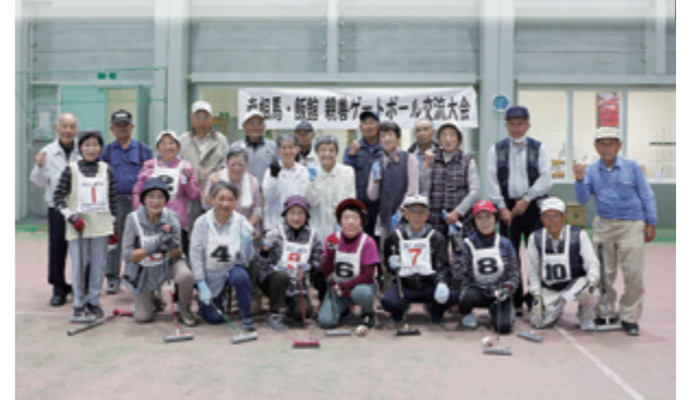
両地区選手の混合チームで試合を楽しみました。