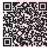
いいたて移住サポートセンター e_village_life_iitate