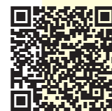
村民の森あいの沢・宿泊体験館きこり iitate_kikori_ainosawa