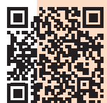
特別養護老人ホームいいたてホーム iitate_home