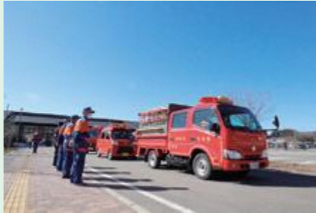
飯館村消防団は防火パレードを行い、村内各地区で焼却行為等による火災防止を呼び掛けました。

3月1日から7日までの1週間、春季火災予防運動が実施されました。村でも関係機関による火災予防運動がそれぞれに展開され、火災時や災害時の対応の重要性を再認識するよい機会となりました。