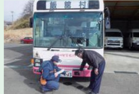
飯館分署は車両火災予防のため、スクールバスの立入検査を行いました。