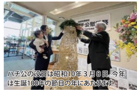
ハチ公の没日は昭和10年3月8日。今年には生誕100年の節目の年にあたります。

3月7日、「忠犬ハチ公」のオブジェを置く道の駅までい館で、村民有志の会がハチ公の慰霊祭を行いました。このハチ公のオブジェは「村民の帰りを待つ」シンボルとして、平成25年に渋谷公園通商店街振興組合から飯館村に贈られたものです。3年に1度の塗り替えには希望の里学園の生徒も協力しています。