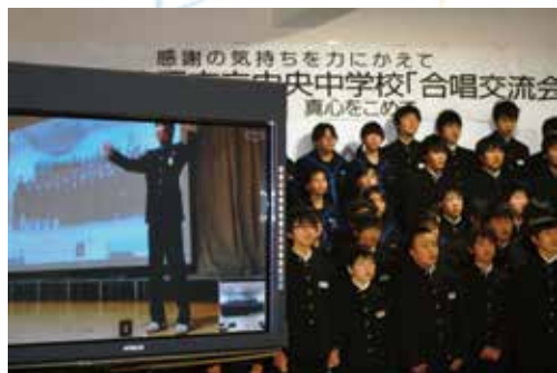
▲2つの学校の歌声が一つになった全員合唱