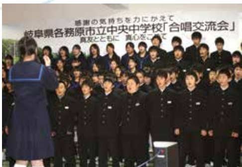
▲校歌を歌う飯館中学校の生徒たち