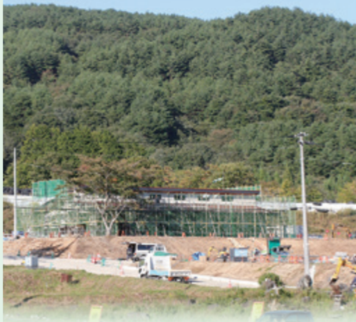
今年度末の完成に向けて建設が進む「居住促進ゾーン 長泥地区集会施設」

村では、長泥地区の再生と発展を見据え、必要な取り組みや事業を、一つひとつ適切に進めていきます。今後は、準備宿泊を行った住民の方から、宿泊時に気になった点等についてお話を伺い、区域の避難指示解除に向けた取り組みに生かしていきたいと考えています。