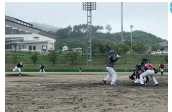
白熱の試合展開が続き、熱く盛り上がりました。

9月4日、いいたて球場で『飯館村野球連盟理事長杯』が3年ぶりに開催されました。大会は「ファイターズ」「ファーマーズ」「上飯樋野球クラブ」「飯館村役場」の参加4チームによるトーナメント戦で行われました。チームの枠を越えて交流を深めながら、笑顔でプレーしていた選手の皆さん。楽しそうな声が球場の外まで響いていました。 優勝 飯館村役場 準優勝 ファイターズ