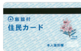
今までの住民カード