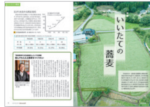
「いいたての蕎麦」を特集した広報いいたて（令和3年6月号）の紙面

第 67回福島県市町村広報協会コンクールの広報紙部門で、「広報いいたて」が町村の部の佳作に入賞しました。また、「同コンクールの全市町村を対象とした映像部門で、「ネイティブスピーカー」カース飯館言葉の達人たち」が佳作を受賞しました。飯館村の広報紙は、毎号たくさんの方のご協力をいただきながら制作されています。村は今回の受賞についても、各種取材に快く応じてくださる村民の皆さんと共にいただいた賞であると受け止めています。日頃よりのご協力に改めて感謝申し上げます。一方の動画は、広報紙をきっかけに、各種デジタルコンテンツにも親しんでいただくとうと始まった企画で、飯館の方言を学びながら、ゆるく楽しく手作りの動画を配信しています。普段は動画にあまり触れる機会のない方も、得意な若者にちよつと聞いてみたりして、試しにご視聴いただければ幸いです。