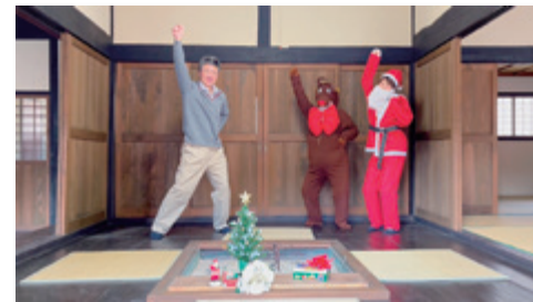
方言がテーマのミニ動画「ネイティブ・スピーカー」カース飯館言葉の達人たち」の一場面 ※各号裏表紙をご覧ください