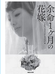
著者…TBS 「イブニング・ファイブ」 出版社…マガジンハウス

「今、何してるの?」「生きてる。」彼女がどんな姿になっても愛し続けた彼の愛の大きさと生きていることの奇跡に気付かせてくれる本です。大切な人がいること、生きていることに感謝……。