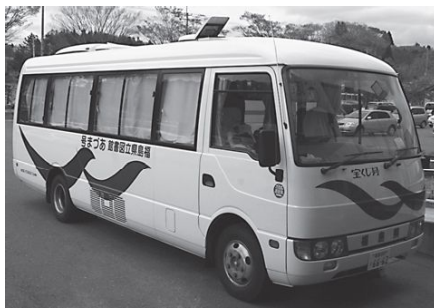
▲来村した移動図書館「あづま号」