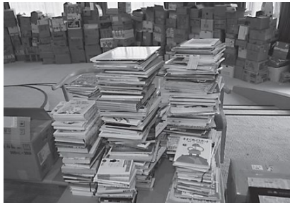
▲全国から集まった絵本（後ろの箱も全部絵本です）