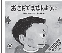
作…くすのきしげのり 絵…石井聖岳 出版社…小学館

小学校低学年向けの絵本です。泣きました。もしかしたら、どんな育児書よりも参考になりました。しかるの親の役目。でも後悔の連続。それでも子供の気持ちに寄りそえる大人になりたいと思いました。