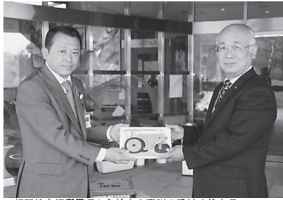
▲相双地方振興局長から絵本の寄贈を受ける教育長

寄贈された沢山の絵本を有効に活用するために、委員会を組織してその使い方を検討していきます。