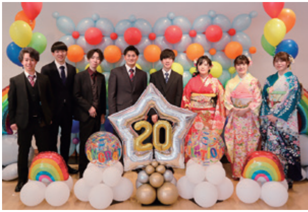
会場のフォトスポットにて。実行委員の皆さん

成人式実行委員会の活躍 新成人有志による実行委員会が、生涯学習課と協力して、この素晴らしい式をつくり上げました。懇親会の開催は見送られましたが、式の後にも写真を撮り合ったり、中学校時代の写真の展示に寄せ書きをしたり、名残りが尽きない再会のひとときを過ごしていました。