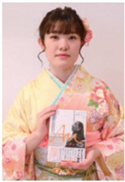
新成人が『20歳の20冊』から選んだ1冊を贈りました

成人式実行委員会の活躍 新成人有志による実行委員会が、生涯学習課と協力して、この素晴らしい式をつくり上げました。懇親会の開催は見送られましたが、式の後にも写真を撮り合ったり、中学校時代の写真の展示に寄せ書きをしたり、名残りが尽きない再会のひとときを過ごしていました。