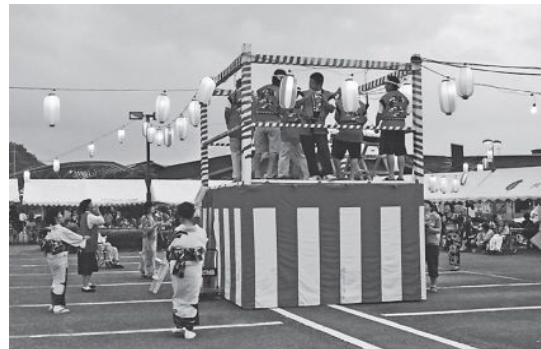
▲澄美れ会の「大黒舞」と、はなつか太鼓の「祭りばやし」