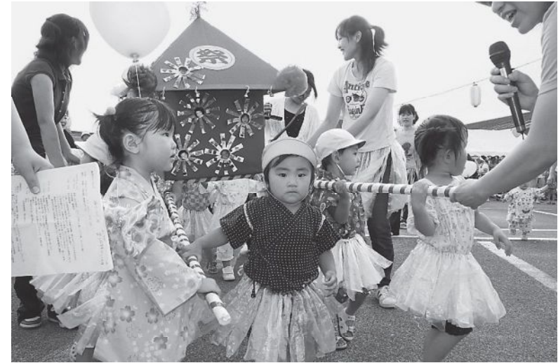
▲御みこしの入場でまつりがスタート

いいたてホームの「夏まつり」がホーム前庭と駐車場を会場に開催されました。今年で13回目を数えるこの夏まつりを入居者とその家族、職員らと来場者が楽しみました。 まつりでは、地域の子どもたちとやまゆり保育所の園児がかつく御みこしに入居者と職員の仮装行列が続き会場をわかせました。 また、飯館フクラクラブのフラダンス、やまゆり保育所園児によるダンス、澄美れ会による大