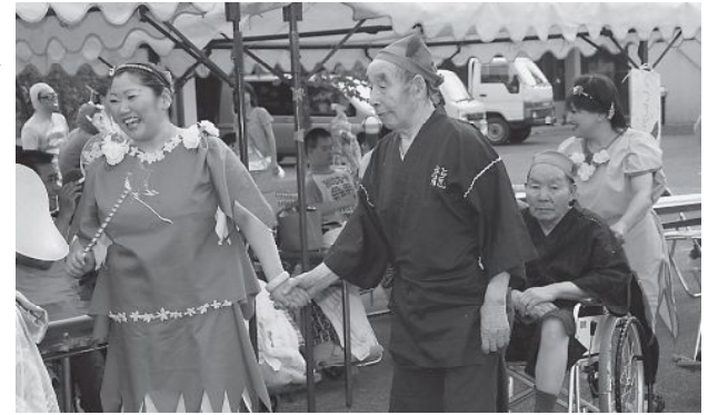
▲入居者のみなさんと職員の仮装行列

黒舞、入居者と職員によるやまゆりさん体操とたくさんのアトラクションがまつりを盛り上げました。 会場を囲むように張られたテント内でも、多くのボランティアのみなさん、ホーム職員などが焼き鳥やカキ氷などの模擬店を開き、買い求める人たちが列をつくりました。 まつりの最後に行われた盆踊りでは、はなつか太鼓のみなさんの祭りばやしに合わせ入居者、家族、地域の方々が一緒に輪をつくり夏の恒例行事を楽しみました。