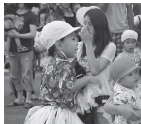
▲やまゆり保育所の園児たちによるダンス