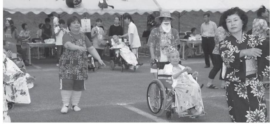
▲みんなで踊った盆踊り