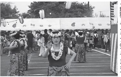
▲飯館フクラクラブのフラダンス