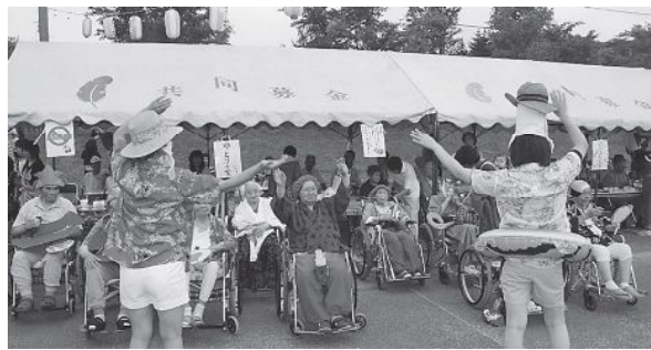
▲やまゆりさん体操も踊りました