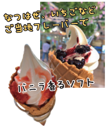
なつはぜ、いちごなど ご当地フレーパーで