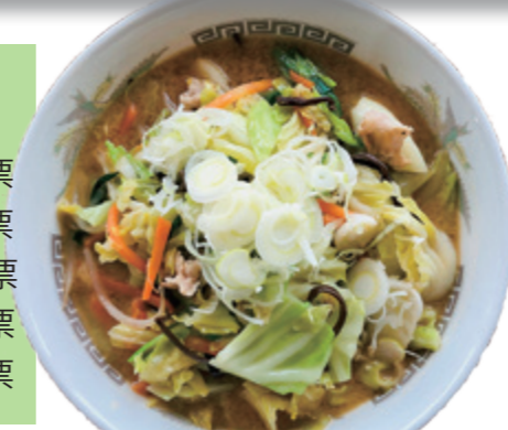
野菜味噌ラーメン

道の駅のレストランは、平日は村内で働く人の昼食や、サークルなどの会食で。休日は家族連れや、村外の皆さんの利用でにぎわっています。「長崎ちゃんぽん」や「伊勢うどん」は縁あるご当地の味をそのままに。蕎麦は村産の蕎麦粉で村民が手打ちしています。野菜ももりの「野菜味噌ラーメン」や、追い飯付きの「極旨まぜそば」など、「来てくれた方を喜ばせたい」「心で、工夫あるメニューをこつこつ増やしてきました。人気投票では麺類が強さを見せましたが、村産のお米を使ったご飯物もおいしいですよ！