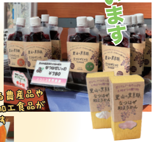
村民がつくる農産物や こだわりの加工食品が 並んでいます