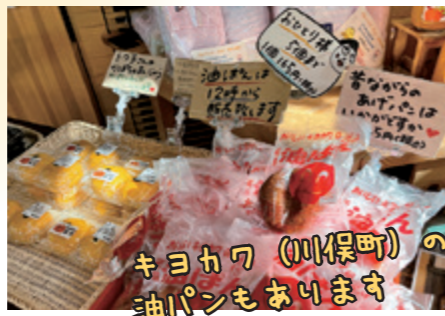
キヨカワ（川俣町）の 油パンもあります