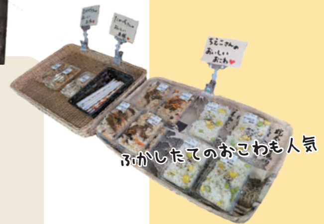
ふかしたてのおこわも人気