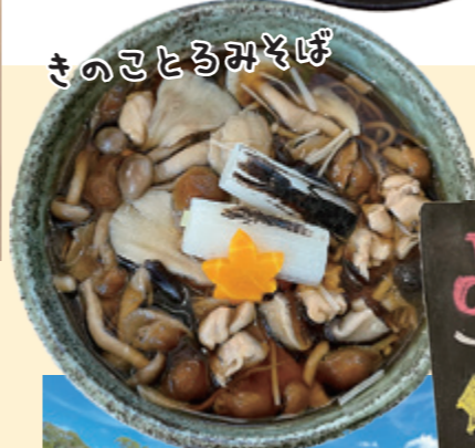
きのこころみそば