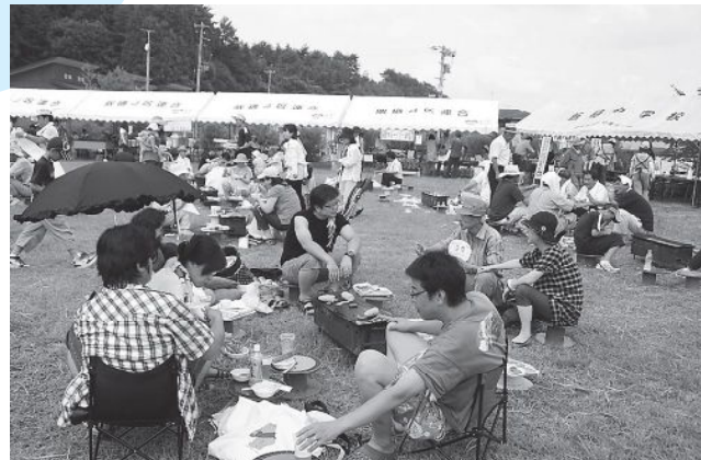
▲会場中央の焼肉コーナー