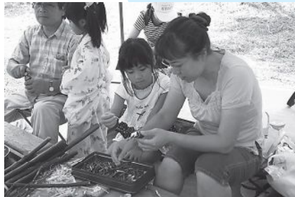
▲農家レストラン気まぐれ茶屋ちえこ ▲森林組合の木工教室のようす