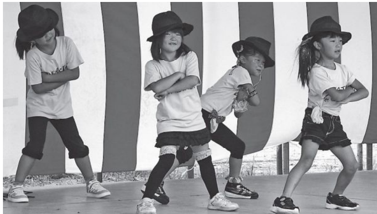
▲「GeNeSIS」のヒップホップダンス