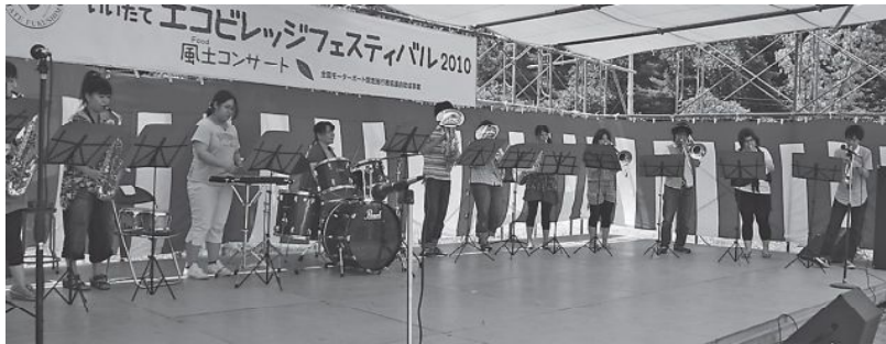
▲福島学院大学の学生アンサンブルクラブ