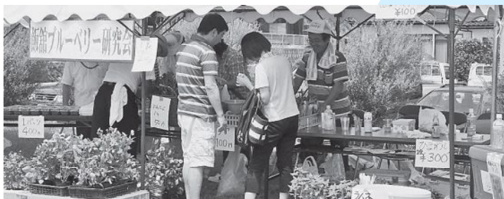
▲いいたてブルーベリー研究会のコーナー