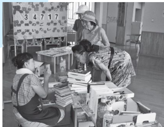
▲「ほんの森」に設置された「絵本交換コーナー」