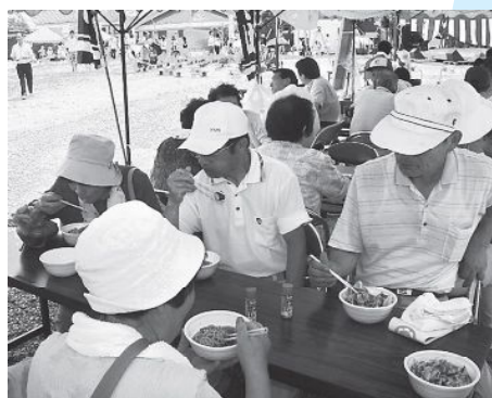
▲「愚真会」愛の手打ちそば