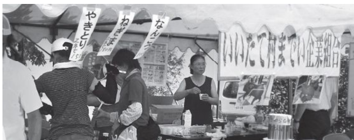
▲いいたて村までい企業組合のコーナー