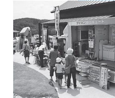
▲エコキュート（上）、ソーラークッカー（右）など「エコ」製品も展示されました