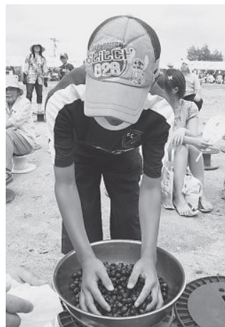
▲ブルーベリーつかみどり