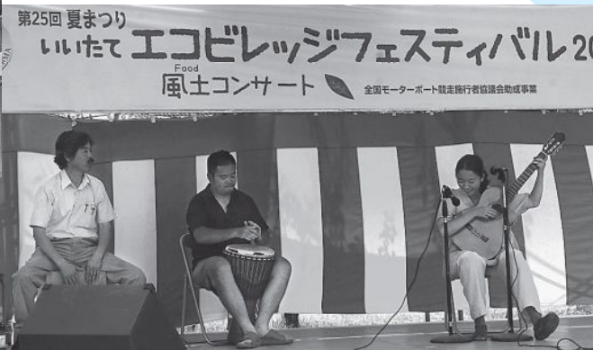
▲飛び入り参加の「さちとむらと」