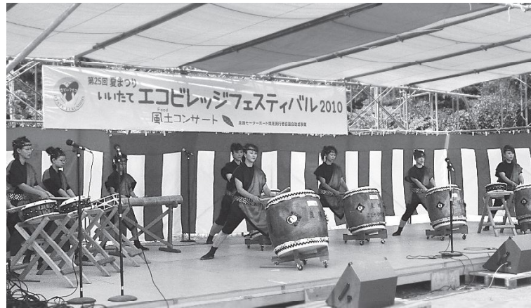
▲「虎捕太鼓」でフェスティバルスタート