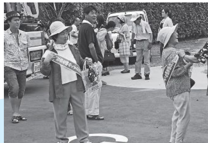
▲社会を明るくする運動