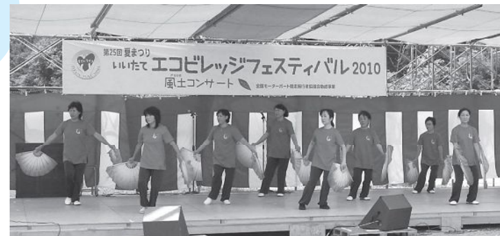
▲いいたて太極拳サークル