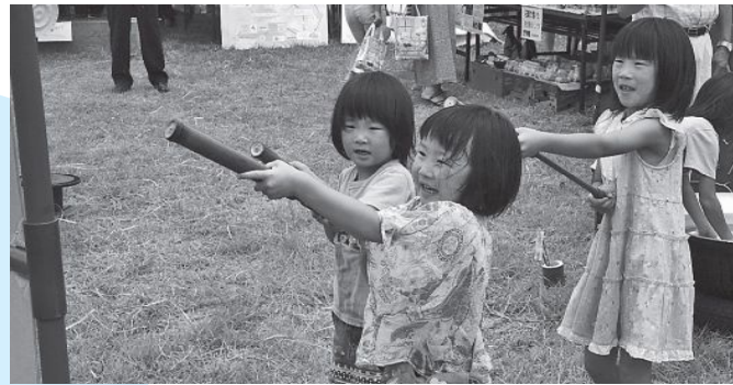
▲昔ながらの水鉄砲は子どもに大人気（老人クラブ連合会）