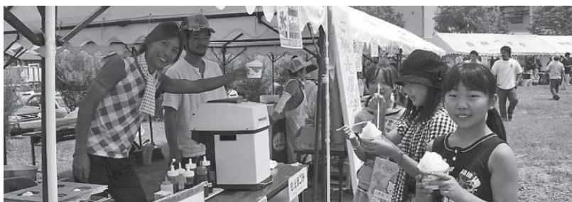
▲商工会のご馳走屋台