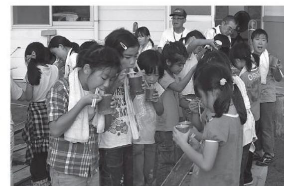
▲「すごくおいしい」と手打ち流しそうめんを食べる子どもたち (しんちゃんハウス)

「までいな休日」事業は今後も継続して村民と首都圏の人たちとの交流を深めていきます。