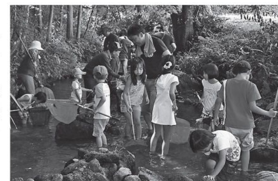
▲川遊びを楽しむ家族 (きれいのたね)