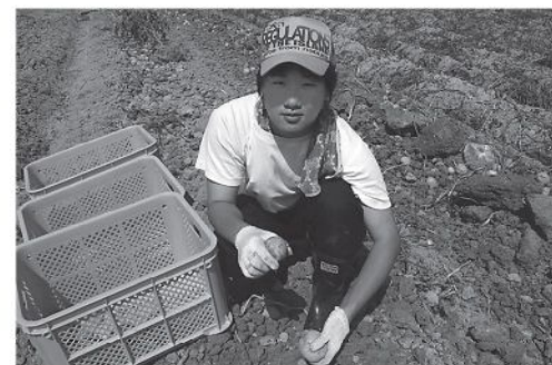
▲ジャガイモの収穫作業を体験する高校生

村では、交流人口を増やすことを目的に、首都圏の団体や個人を対象に交流事業を実施しました。事業を通じて村民の方々と来村者の交流が深まりました。