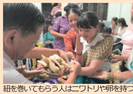
紐を巻いてもらう人は二ワトリや卵を持つ

ラオスでは、人生の節目となる記念行事やお祝いの際に、土着の精霊信仰(アニミズム)から生まれた「パーシー・スー・クワン」という儀式を行います。精霊信仰では、人間の身体には32の魂(クワン)が宿っているとされ、これが抜けてしまうと不幸なことが起きるとされています。したがって、このクワンが身体から外に出ないように健康や幸運を祈願するのです。現在では仏教文化と融合し、日常のさまざまな場面で行われています。儀式では、まず長となる人物がお経を唱え、その後参加者同士で祭壇にかけられていた紐を手首に巻いていきます。紐を巻く人は「幸運は中へ、悪いものは外へ。あなたに幸運が訪れますように」と相手の幸福を願う言葉を唱え、このとき紐を巻いてもらっている人の周囲の人はその人のからだに触れます。そうすることで、直接は紐を巻いてはいないけれど、同じく幸運を願うことができるのです。 私はラオス滞在中に、結婚式・旧正月・引越越し・歓送迎会などでパーシーを経験しました。パーシー当日に心が温まることはもちろんですが、巻いてもらった白い紐は自然に切れるのを待つことになるため、その間もみんなからの愛を感じることができると大好きな行事です。