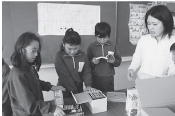
▲贈呈された絵本に興味深々の児童