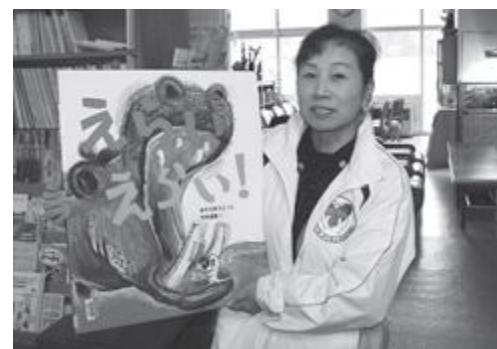
▲大型絵本も借りました

貸出しを受けた本は公民館正面入口前の「移動図書」のコーナーにありますのでぜひご利用ください。