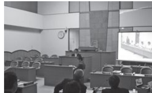
▲議員による研修発表のようす