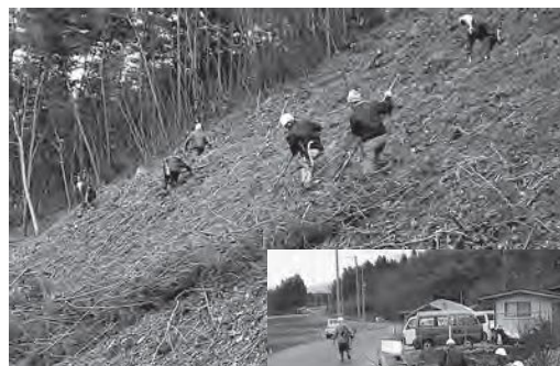
▼側溝の土砂上げ作業のようす

2,000 万円の予算で実施されたこの事業で、18 行政区、延 2,700 人が作業を行いました。