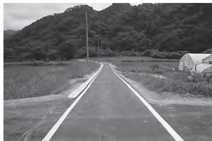
路線名：北ノ坂湯舟線 場所：大倉字湯舟地内 工事概要：現道舗装工事