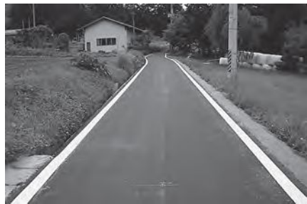
路線名：長泥 2 号線 場所：長泥字長泥地内 工事概要：現道舗装工事