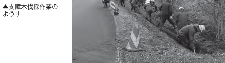
▲支障木伐採作業のようす