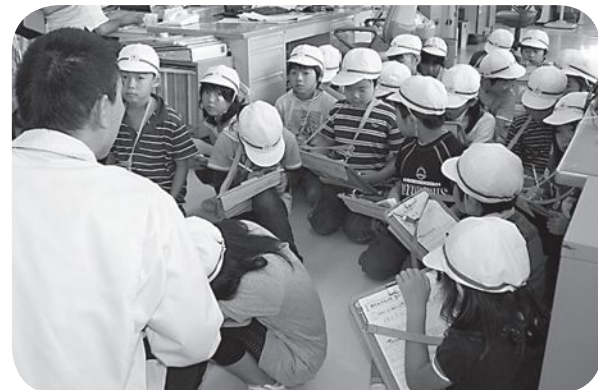
▲熱心に質問する2年生

飯樋小学校の2年生が社会科見学のため役場を訪れ、各課が担当している仕事などを学びました。