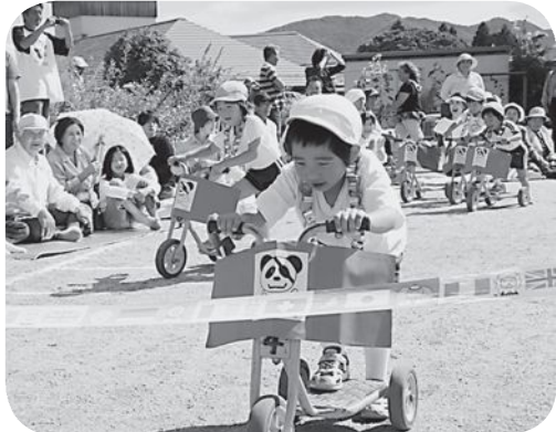
▲「ボクの海ぞく船が一番早いよ」(飯樋幼稚園)