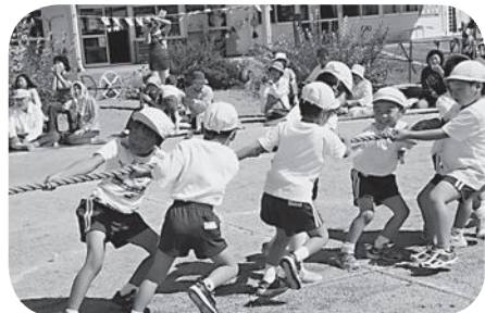
▲「もっと、引っ張れ〜」(飯樋幼稚園)