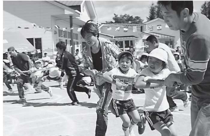
▲「パパ、負けないで！」(草野幼稚園)

草野・飯樋両幼稚園の運動会が行われ、園児たちがダンスやかけっこ、親子競技などの種目に元気に参加しました。