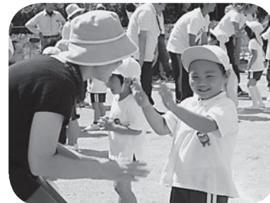
▲「ママとダンス楽しいな」(草野幼稚園)