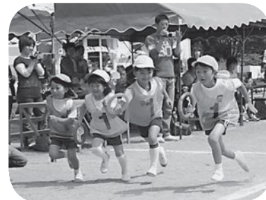
▲「よーい、スタート！」(草野幼稚園)