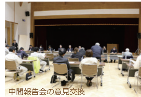
中間報告会の意見交換