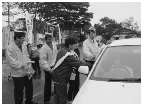
▲ドライバーに安全運転を呼びかける参加者