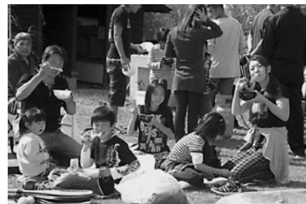
▲「できたてホヤホヤ、おいしいよ」

作業を終えた後は、いも煮会や釣り、バトミントンなどを楽しみ、充実した1日を過ごしていました。