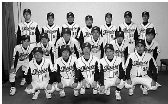
▲全力を尽くした飯館チーム