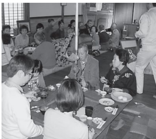
▲新米のおむすびやどぶろくを味わう参加者

安心・安全な食や「までいライフ」を通して「飯館流スローライフ」を体験してもらおうと、「まるごと飯館バスツアー」が開かれ、東京都目黒区を中心とした25人が参加しました。参加者は、飯館牛、旬の里山料理を味わった後、木工クラフト体験や紅葉のあいの沢散策を行い、自然豊かな秋を満喫。農家民宿した先では、住民と交流する姿も見られました。翌日、見学先の農家でトルコギキョウの花摘みや野菜の収穫体験。どぶろく特区の気まぐれ茶屋では、新米のおむすびやどぶろくなどを味わっていました。