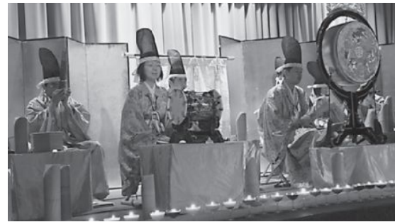
▲ろうそくの灯の中、雅楽演奏が行われました