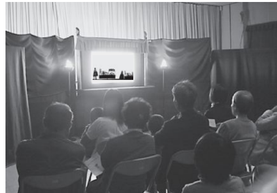
▲ジュニアリーダーによる影絵を楽しむ来場者