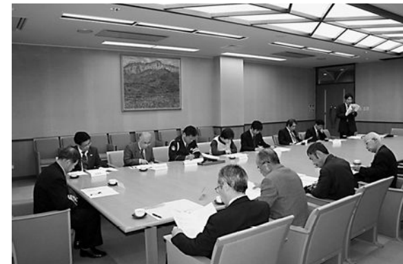
▲今後の体制を協議した公共交通会議

「飯館村地域公共交通会議」が、村役場にて開催され、路線バスの廃止や廃止後の対策等を議論しました。 地域公共交通会議とは、平成18年の道路運送法の改正により制度化されたもので、国・県をはじめ、福島交通(株)などの運送事業者や交通機関利用者の代表を含む関係者で構成され、地域