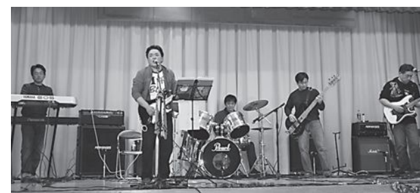
▲エネルギーあふれる演奏を披露するJ-BOX

また、会場には募金箱が設置され、来場者からあたたかな募金を寄せられました。この募金は、今後、子どもたちのために寄付される予定です。