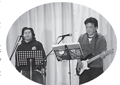
▲Project-O 2 （オーツー）の弾き語り