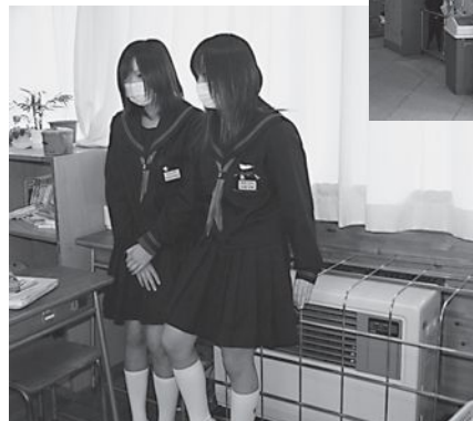
▲教室や玄関口に新たに整備された暖房機

生徒からは「登校時に玄関が暖かくてうれしい」「寒いと集中力も下がる。教室があたたかいので勉強のやる気にもつながる」と評判も上々です。