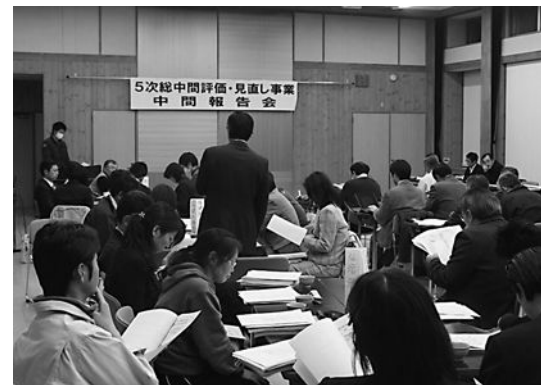
▲活発な意見が交わされた中間報告会

また、重点化すべき事業として、「子育て支援センターの整備」や「凍結時に安全な道路の整備」(月1回は、公式の行事をもたない日を設け、家族団らんの時を設定)「までいブランドの推進」などが各部会からピックアップされました。 会場からは「ごみ軽量化は村でがんばっている。村民へ目に見えるの利益還元も必要では」「各部門で連携して進めるべき事業もある」などの活発な意見交換が行なわれました。 今後、部会ごとに最終報告書をまとめ、来年度以降の事業に反映させることとしています。