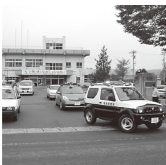
▲防犯ミニパレード