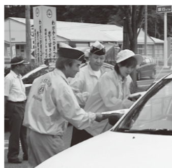
▲街頭キャンペーン