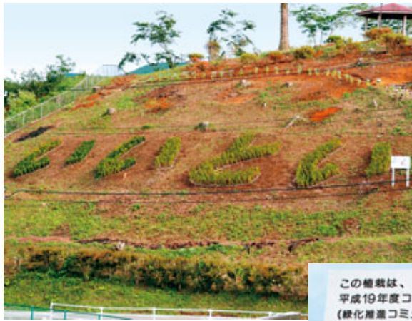
▲コミュニティ助成事業で「いいとい」の文字に植栽した920本のキャラ