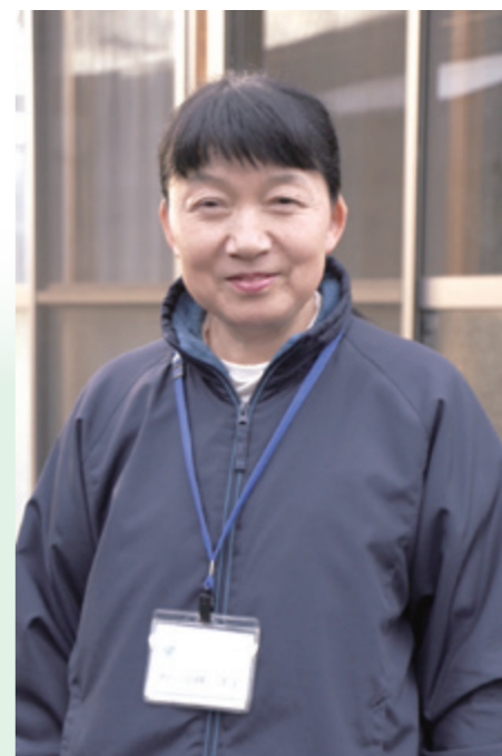
芦原地区出身。家族と共に入居した旧明治小仮設住宅の管理人を、住宅が設置された当初から務めてきました。村婦人会や行政区の庶務なども担っています。

管理人を務めてきた旧明治小仮設も、入居者が少なくなり、談話室の荷物を少しずつ整理しています。広報物や資料は、分類してアーカイブにするつもりです。特別な期間でしたからね。 つい先日、私も退去届を出しました。あと少しで引越します。 仮設で隣同士に住んでいた義理の両親は、避難の間に亡くなってしまいました。仮設から高校に通った娘は今、避難先に建てた家から仕事に通っています。村内に職場が