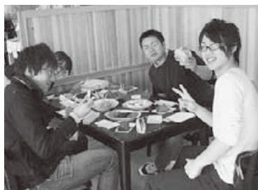
▲「農の恵み」を試食する来場者