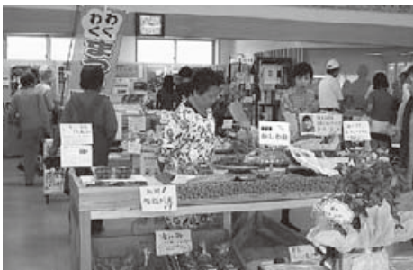
▲ワクワクまつりのようす

もりの駅「まごころ」では、村の「春」を多くの人に感じてもらうと4月29日から5月6日まで「春のワクワクまつり」を開催しました。 「農の恵みの試食会」では4月から学校給食に導入されている米粉パン、ヤーコンうどん、手打ちそばなどがふるまわれ、立ち寄った観光客や買い物客にも大好評でした。 またスタンプラリーや、郷土芸能発表などのイベントも行われ期間中、約2500人が来場しました。