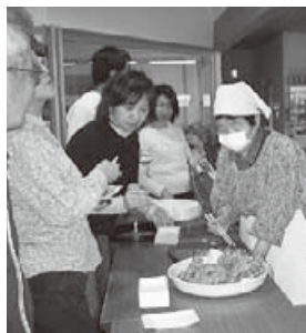
▲山の幸もふるまわれました