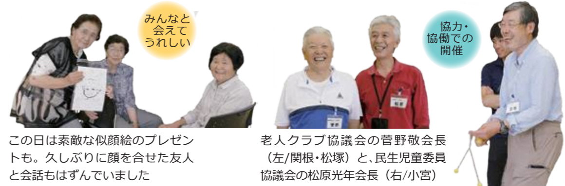
この日は素敵な似顔絵のプレゼントも。久しぶりに顔を合せた友人と会話もはずんでいました