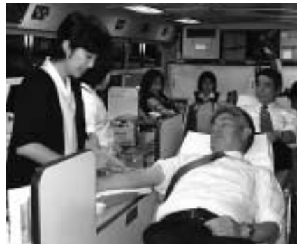
▲多くのご協力ありがとうございました