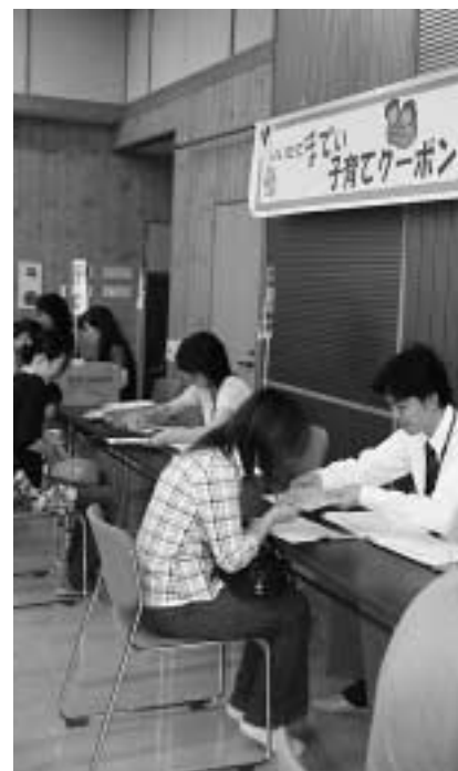
▲クーポンを受け取る対象者ら