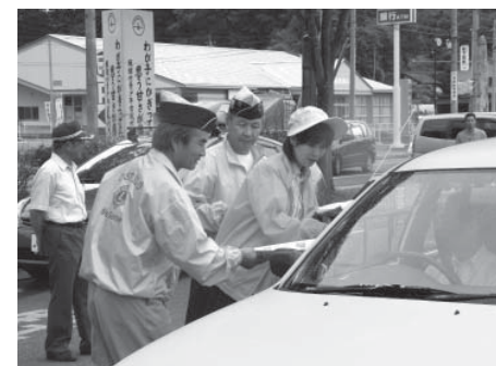
▲安全運転を呼びかける参加者ら