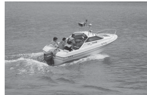
▲モーターボート湖上遊覧