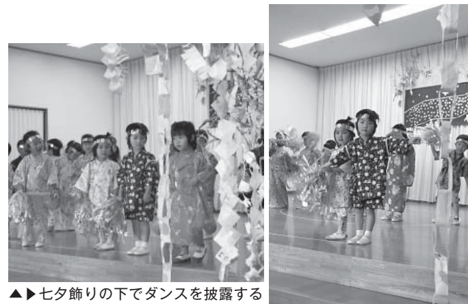
▲七夕飾りの下でダンスを披露する園児たち（たなばた会）