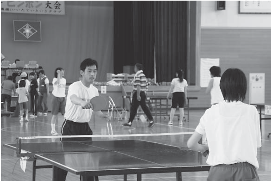
▲ラリーを続ける参加者ら