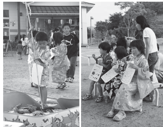
▲かき氷を食べたりお菓子釣りを楽しむ園児たち（夕涼み会）

草野・飯樋両幼稚園で、園児や保護者らによる夏の恒例行事が行われました。 このうち草野幼稚園では、プレイルームで「たなばた会」が行なわれ、未就園児や保護者が見守る中、園児たちがクラス毎に可愛らしいダンスを披露しました。 また、「夕涼み会」では、園庭に保護者らによるクジ引きやカキ氷などの出店、肝試しコーナーなどが設けられ、会場は大いに賑わいました。 両日とも、園児たちが色とりどりの浴衣や甚平を着て参加し、家族らと一緒に楽しい夏のひと時を過ごしました。