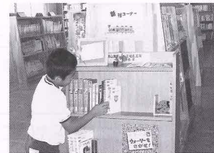
新刊コーナーの設置