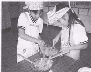
サツマイモでスイートポテト、ジャガイモでフライドポテトとポテトチップス(4年生)