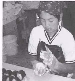
バケツで栽培した稲で「おにぎりづくり」をしました。(5年生)