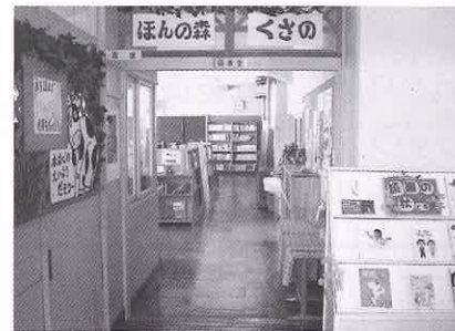
まずは、玄関口の創意工夫を考えました。