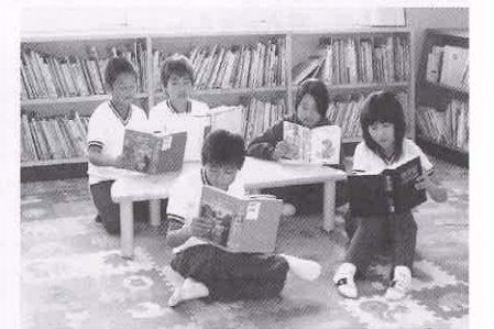
座って読書ができる環境を!