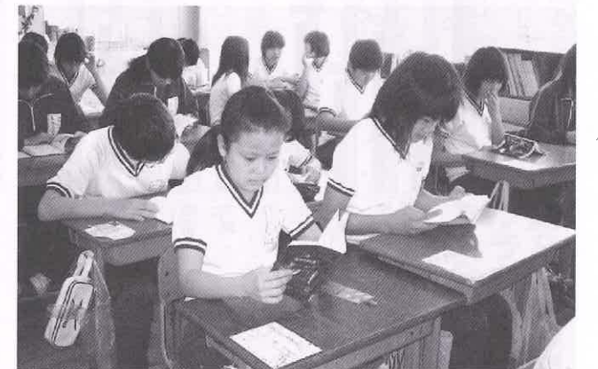
週4日間の読書タイム(朝)