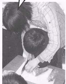
農園で栽培したジャガイモを使って「ジャガバター」と「ポテトサラダ」を作りました。(6年生)