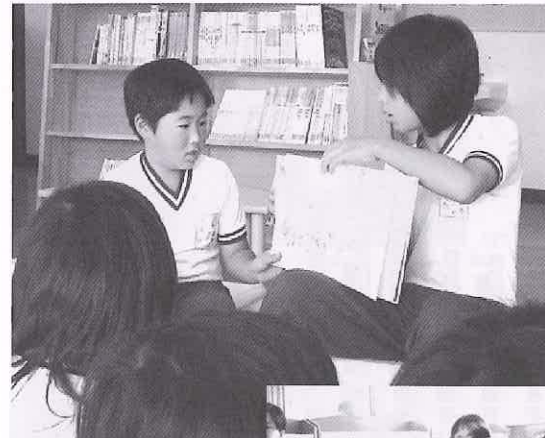
図書委員会による読み聞かせ