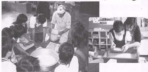
4月に植えた「ケナフ」を使っての「紙すき体験」、貴重な感動体験でした。(科学クラブ)

感謝祭では、調理や木工クラフト、紙すき体験など、親子での触れ合いを楽しみました。