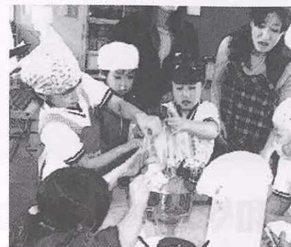
コンニャクづくりは大変でしたが、手作りは最高です。(2年生)