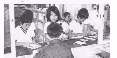
図書委員会の貸し出し