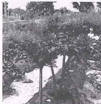
農園のこの植物は? 正体は「こんにゃく芋」です。