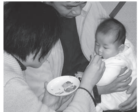
初めての味なので、なめる程度です