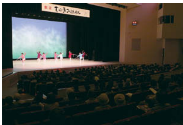
会場は満席。剣を用いた演武を披露しました