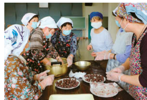
手順を相談しながら約300個の柏餅を作ります