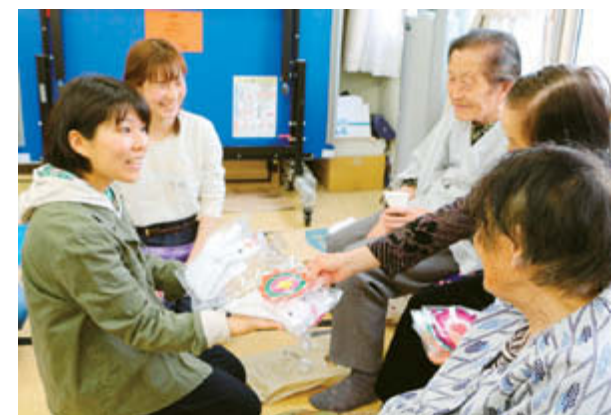
交流に感謝する住民から手作り小物のプレゼント