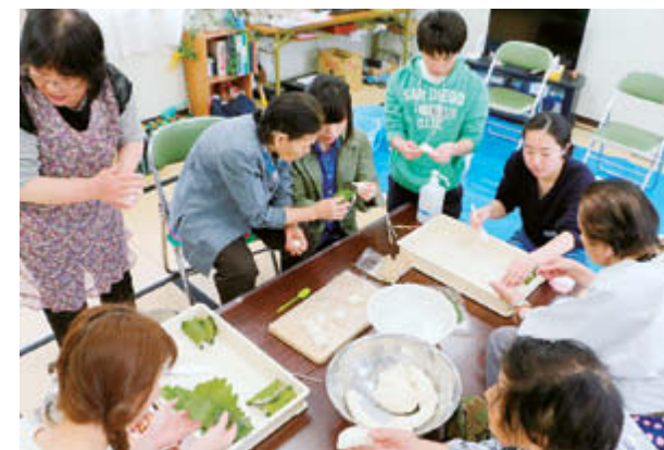
柏餅づくりのコツを学生に伝えつつ楽しく共同作業