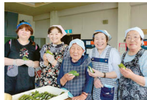
一つひとつをていねいに仕上げ、成形作業を完了

伊達東応急仮設住宅の自治会では、毎年この時期に柏餅づくりを行っています。今年は23人の女性たちが、伊達東地区交流館に集まり、4つの班に分かれて作業を開始。「近所や親戚に配ったよね」「人より早くと」「生懸命仕事したわ」など柏餅の思い出を語りながら、約300個を完成させました。手作りの季節の味は、今年も全ての入居世帯に届けられました。