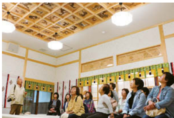
復元のエピソードを聞きながらオオカミ絵を鑑賞

活動を重ねて親交を深めるメンバーの皆さん。今回は15人で村内の視察研修へ。山ツツジ咲く大火山、交流センター「ふれ愛館」、整備中の深谷復興拠点、あいの沢、山津見神社などをバスで回りました。「いい所を見せてもらい観光地に来たようだったよ」「山津見神社のオオカミ絵を知人とまた見に来たい」「懐かしかったな」。再発見の多い一日となったようです。