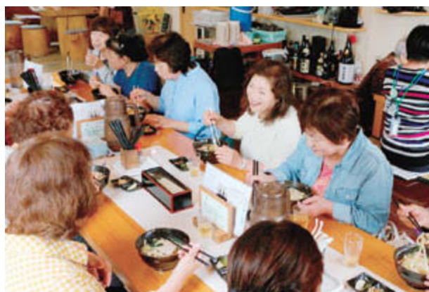
ランチは「あびす庵」で。懐かしい味に思わず笑顔