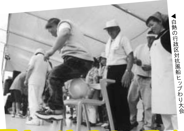
▲白熱の行政区対抗風船ヒップわり大会