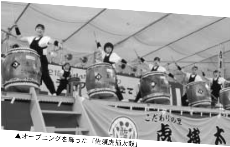
▲オープニングを飾った「佐須虎捕太鼓」