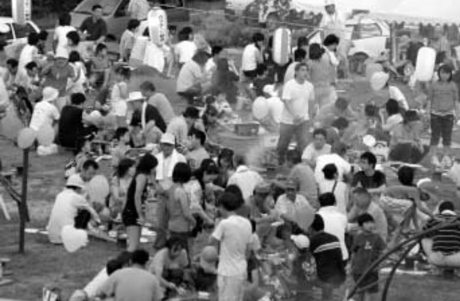
▲まつりは約2,500人のお客さんでにぎわいました