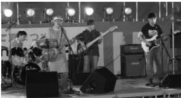
▶いいたて音楽愛好会による バンド演奏