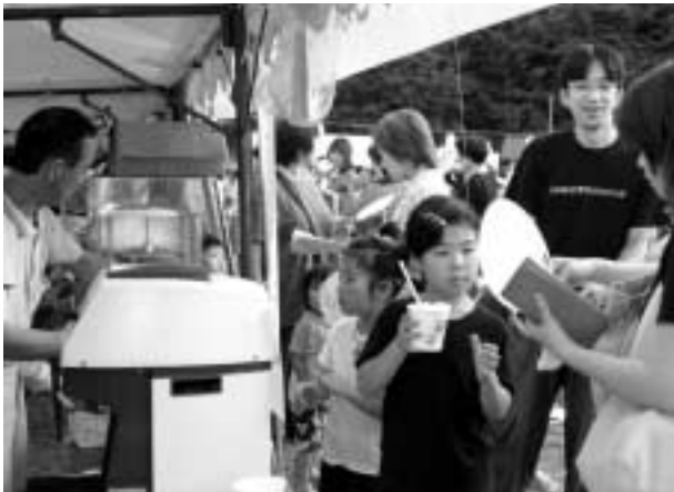
▲商工会コーナーにもお客さんがたくさん