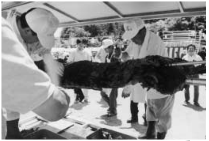
▼まつりのメインディッシュ、牛の丸焼き