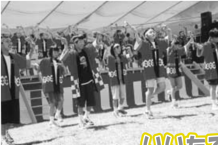
▲草小の子供たちによる エネルギッシュなヨサコイ