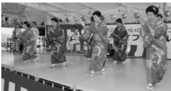
▶民謡愛好会による手踊り