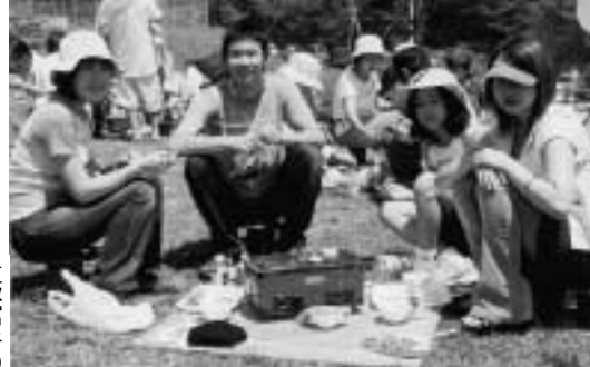
▶飯館牛のバーベキューにみんなおいしい笑顔