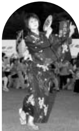
▲にほんまつ先生も 参加しました