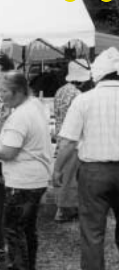
▶はなつか太鼓の見事な演奏 ◀お客さんに好評だった「ふるさと自慢コーナー」(写真は長浜)