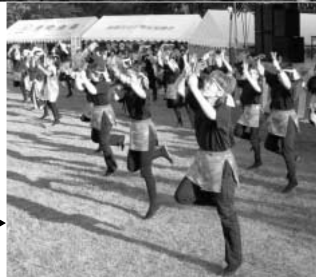
▶まつりを盛り上げた“ヨサコイ” 今回は小高町や新地町からも 応援にきてくれました