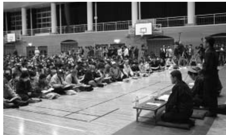
▲謝罪・住民説明会のようす