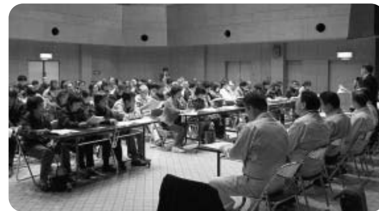
▲住民懇談会のようす