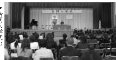
▶合同入学式のようす