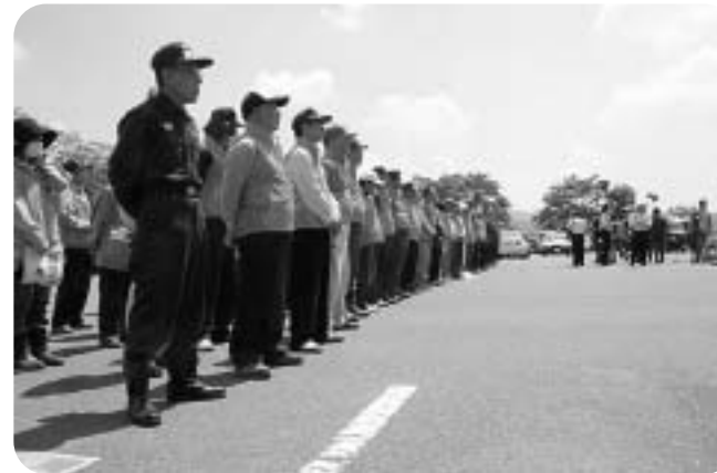
▲いいたて全村見守り隊出発式のようす