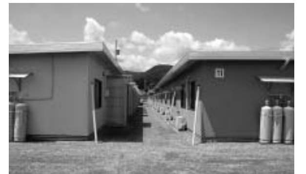
▲完成した仮設住宅(写真は相馬仮設住宅)

また、村役場も6月22日に福島市飯野町に出張所を開所し、以降、業務のほとんどが飯館村役場飯野出張所で行われています。