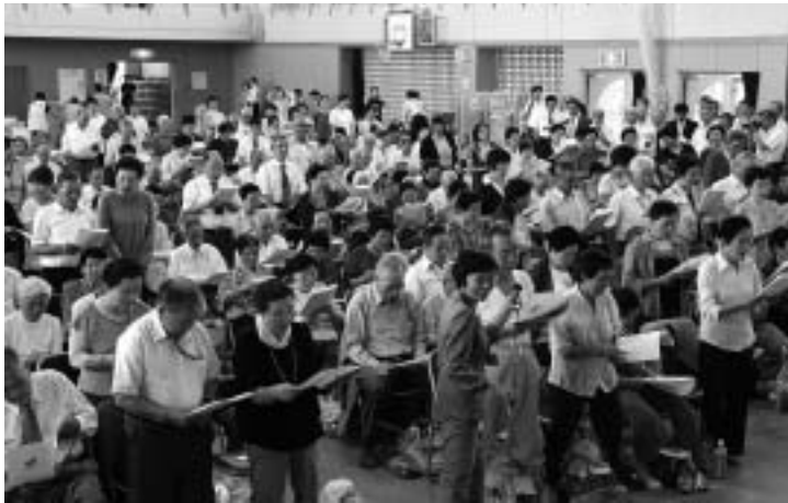
▲「飯館村敬老会」のようす