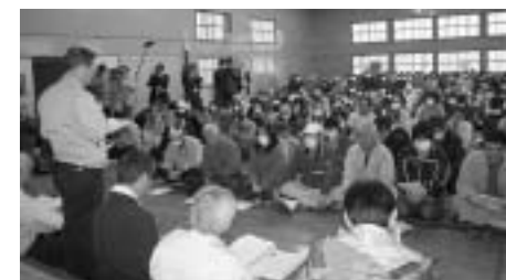
▲村による住民説明会のようす

4月20日、村幼稚園合同入園式と小中学校の合同入学式が、飯館中学校で行なわれました。4月21日からは川俣町の幼稚園、中学校、県立川俣高等学校などに勉学の場を移しました。