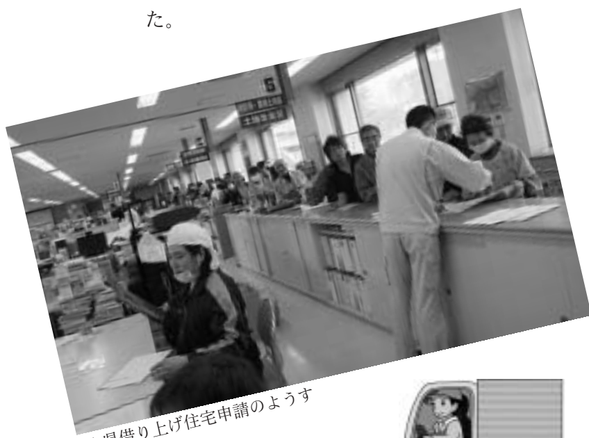
▲県借り上げ住宅申請のようす

5月28日には国や県などが参加し、「ふるさとへの帰還に向けた取組」農地土壌除染技術開発第1回会合が開かれ、農地の放射能除去について話し合いがもたれました。この後、村内では農地の除染に向けた国の実証実験が行われています。