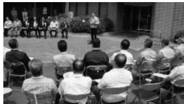
▲飯野出張所開所式(6月22日)のようす