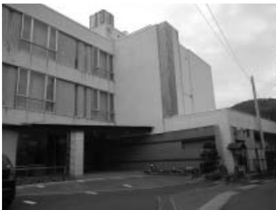
▲福島市飯坂町に開所した「いやしの宿いいたて」