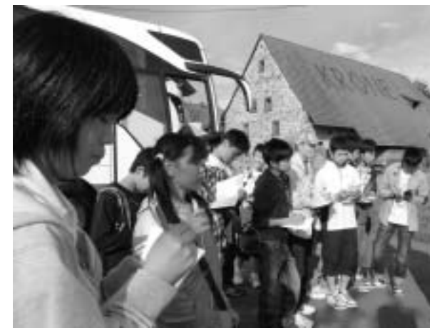
▲ドイツ研修のようす

夏休みには中学生18人が「飯館村未来への翼プロジェクト事業」で8月8日から17日までの日程でドイツ研修を行いました。