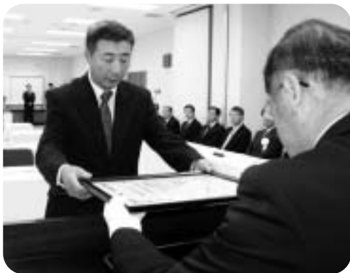
▲飯館村表彰式のようす

9月12日には、福島市飯坂町内に「いやしの宿いいたて」が開所し、会議会場や村民の憩いの場として使用されています。「いやしの宿いいたて」には温泉があり、平成24年1月末現在で延べ8,000人以上が利用しています。