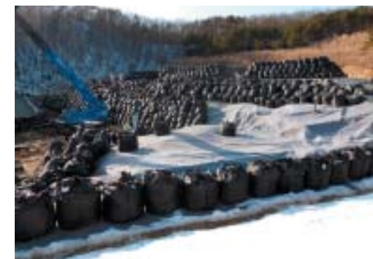
▲黒いコンテナは遮へい用です。このあと覆土をして保管しています

国が実施した除染モデル実証事業で発生した土、木の枝、腐葉土などの除去物を小宮沼平地内のクリアセンターで一時保管しています。