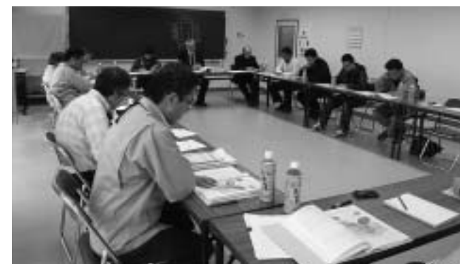
▲いいたて村民復興会議のようす