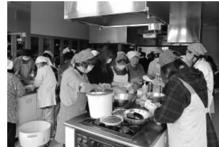
▲いちばん館で行われた避難所への炊き出しのようす

村では避難者を募り、3月19日、20日の2日間で509人が栃木県の鹿沼市総合体育館に避難しました。鹿沼市総合体育館の避難所は4月30日まで開設されました。