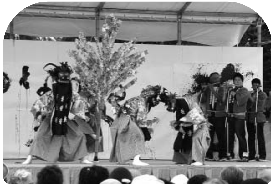
▲絆つながる「までいな1日。」では比曽行政区の「三匹獅子舞」も披露されました